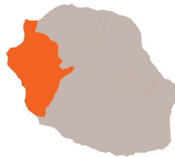
📍 Roquefeuill. Ville